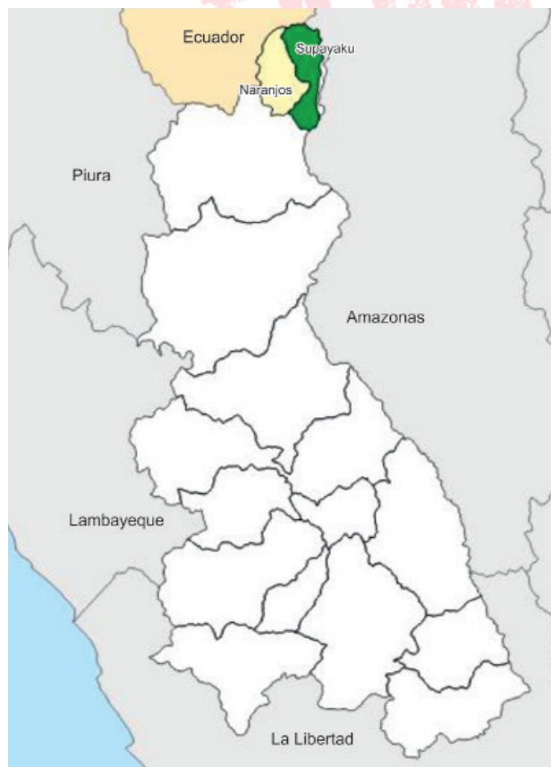
Mapa1. Comunidad Nativas Supayaku