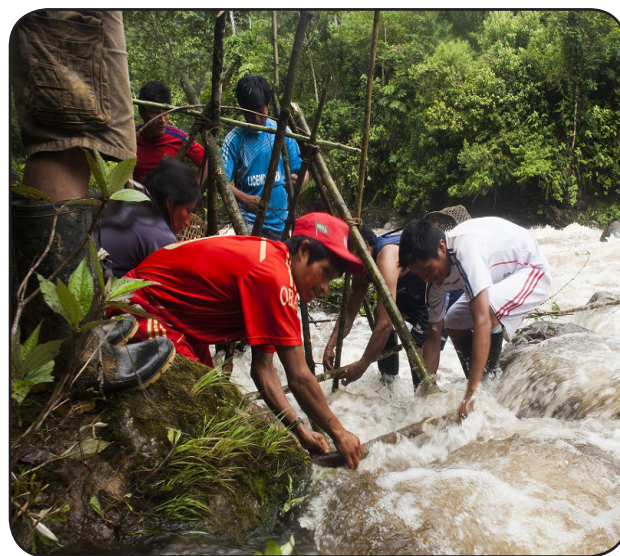
Foto 3 Actividad de Pesca

La recolección de recursos no maderables las realizan también ambos sexos, hombres y mujeres; sin embargo, la caza, la pesca y aprovechamiento de recursos maderables son actividades con mayor exclusividad de los varones.