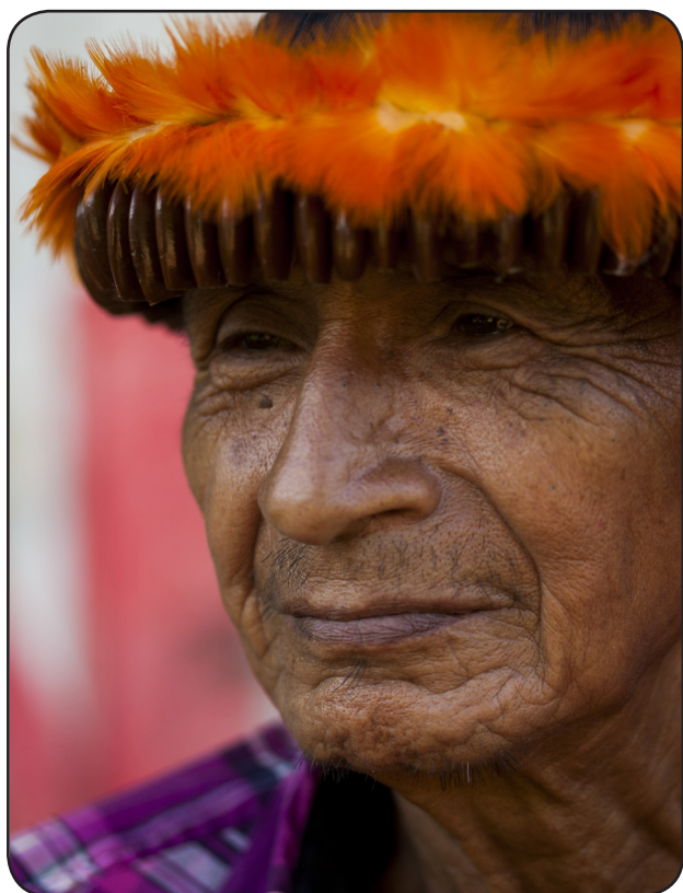
Foto 2. Sabio Awajun

Son reducidos los espacios para que los saberes de los ancianos sabios y sabias transmitan a las nuevas generaciones sus conocimientos, que encierran un importante valor para la comunidad, ya que pueden perderse si estos fallecen.