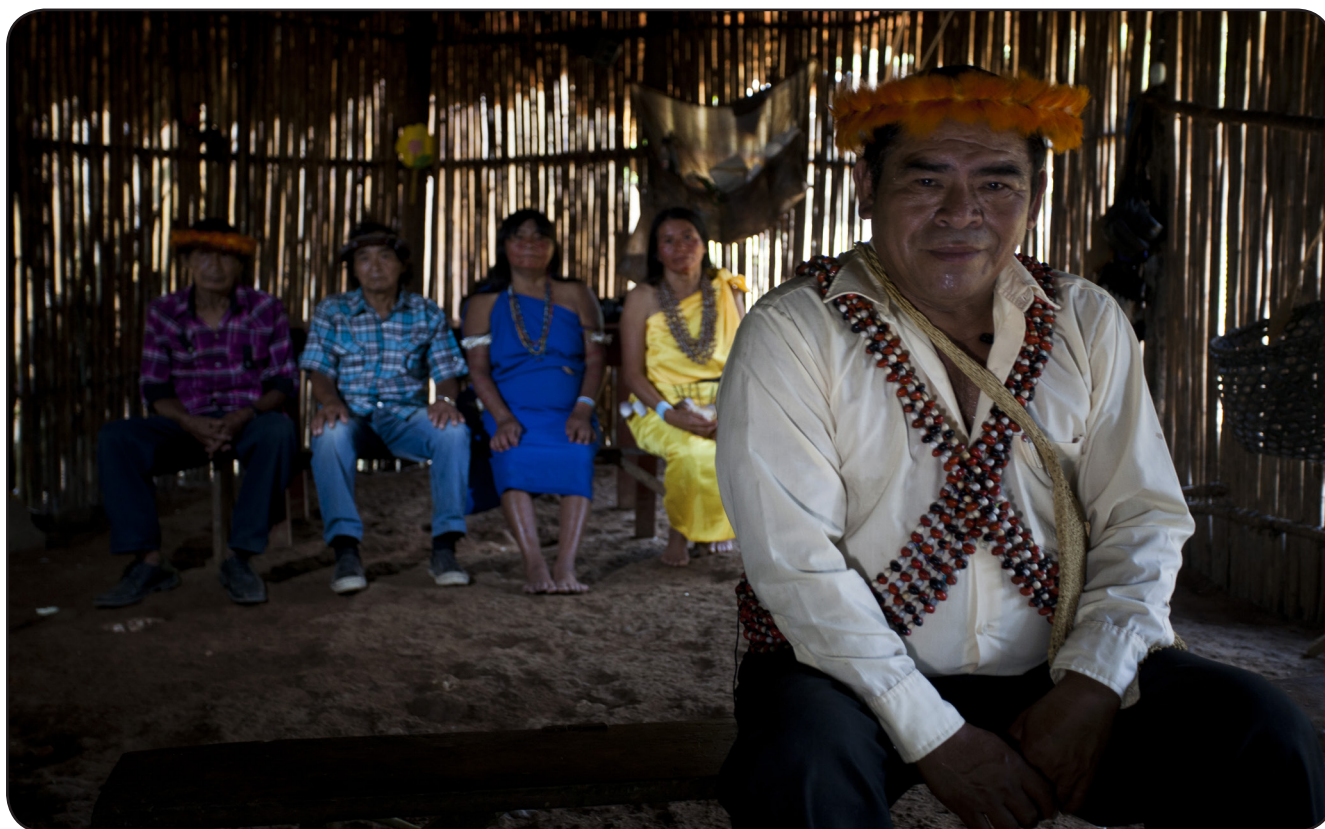
Foto 4. Organización Comunal

La comunidad considera importante el trabajo de instituciones como ONGs que intervienen actualmente en la comunidad. Estas instituciones son "Actores externos a la comunidad con una relación positiva que nos beneficia", a través de su interés de derechos, conservación y fortalecimiento de capacidades para consolidar las organizaciones, las cuales dentro de sus propuestas territoriales contemplan la dimensión ambiental como fundamental para su sobrevivencia material y cultural.