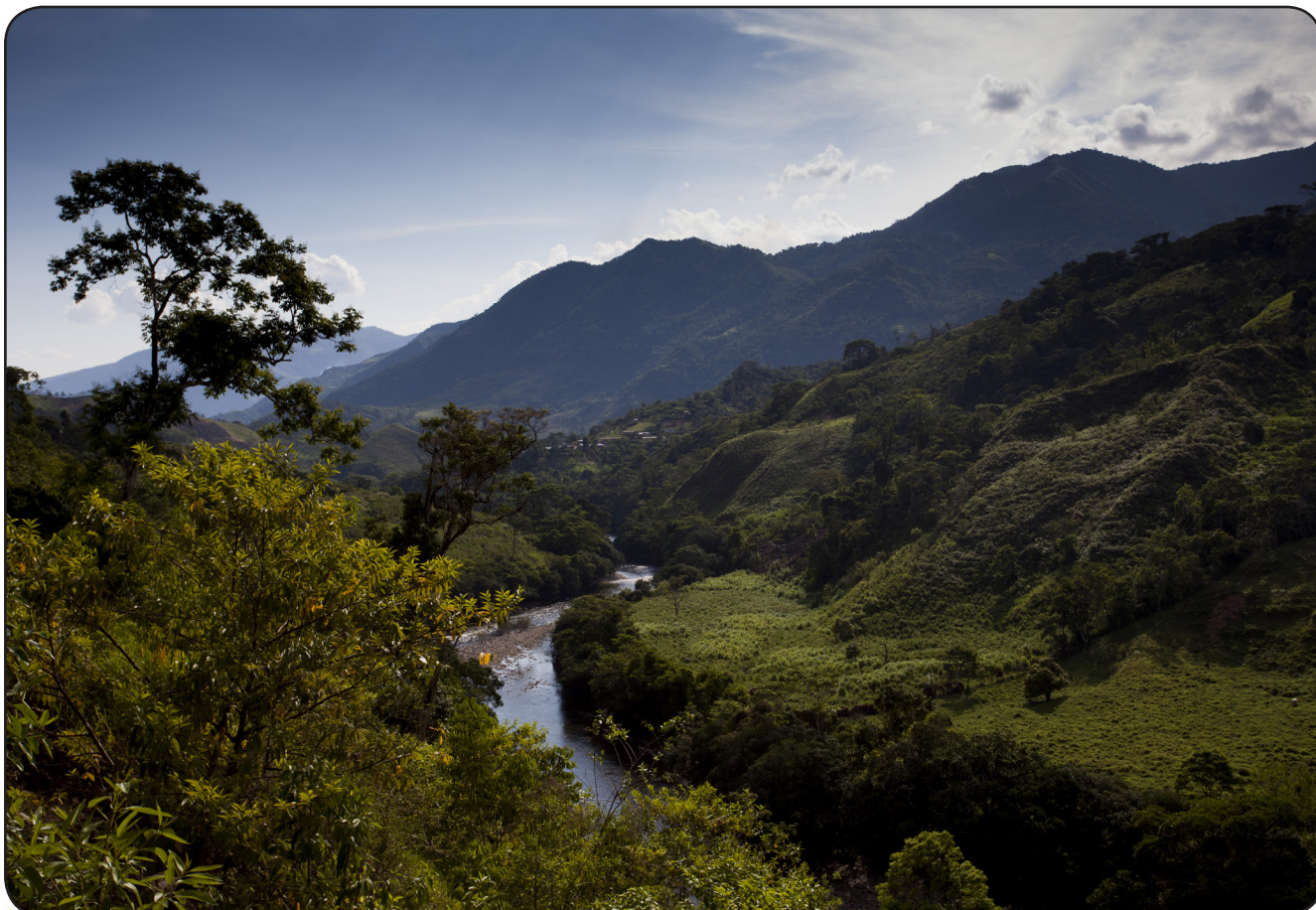
Foto 5. Río Chirinos

Hechos ocurridos recientemente muestran como una gran amenaza la presencia de la Minera Águila Dorada, de capitales Canadienses, que ha logrado el apoyo de la Comunidad Nativa de Naranjos para la explotación de oro y otros minerales en la cabecera de cuenca del Río Chirinos y otros afluentes, lo cual afectaría el ecosistema del bajo Chirinos.