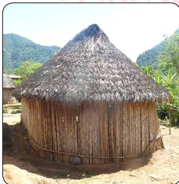
Foto 1. Casa tradicional Awajún

con una forma de justicia consuetudinaria, heredada de nuestros ancestros para resolver problemas dentro de la comunidad y con otras comunidades nativas.