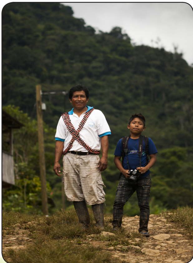
Foto 6. Poblacion Joven con liderazgo